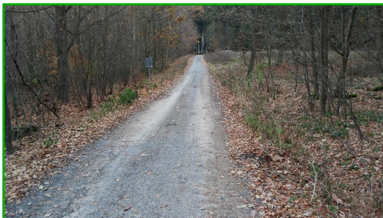
Pohled na cestu ve směru staničení v km 0,000