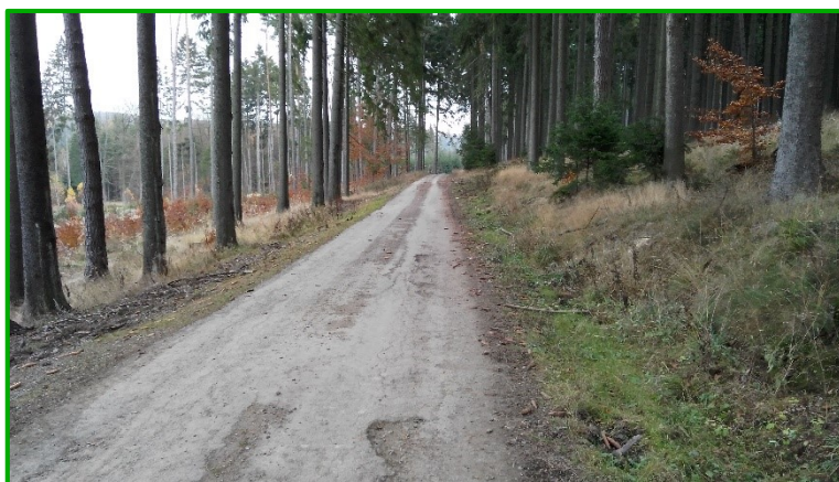
Pohled na vozovku v km 0,400